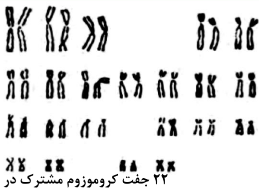
۲۲ جفت کروموزوم مشترک در